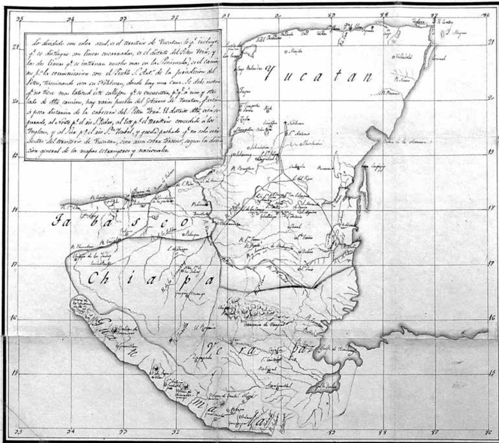
Mapa 1. Mapa de la península de Yucatán

[Mapa en blanco y negro con líneas en colores].